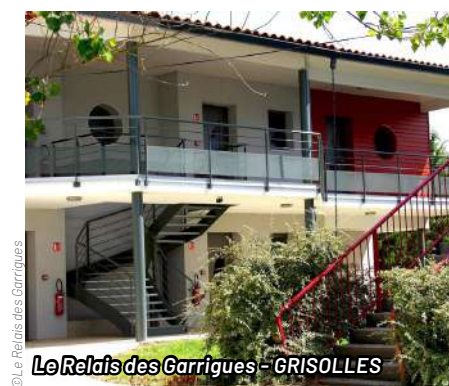
© Le Relais des Garrigues - GRISOLLES