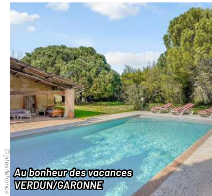
Au bonheur des vacances VERDUN/GARONNE

À partir de 237 € par nuit (minimum 2 nuits)