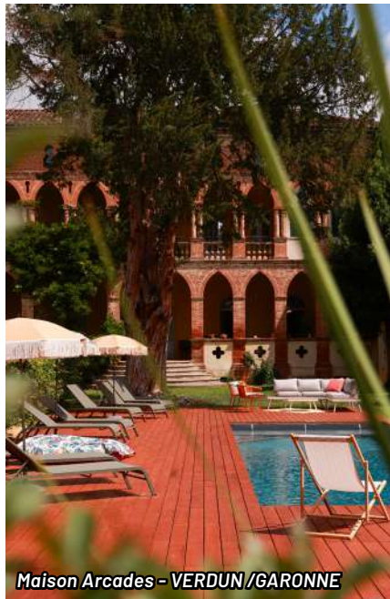
Maison Arcades - VERDUN / GARONNE