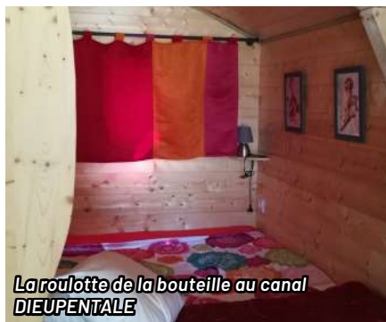
La roulotte de la bouteille au canal DIEUPENTALE