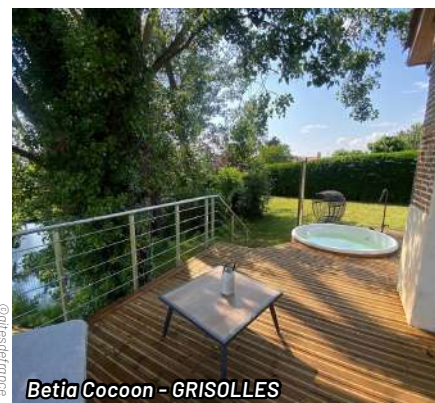
Betia Cocoon - GRISOLLES