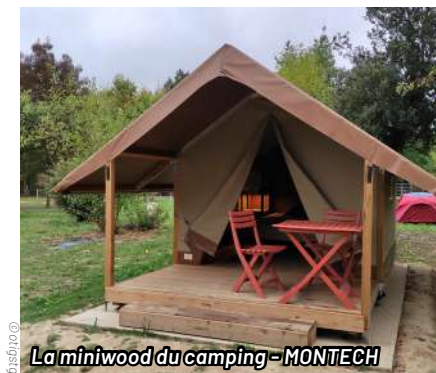
La miniwood du camping - MONTECH

À partir de 69€/nuit. Petit-déjeuner 9€/personne - Plateau repas à partir de 16€