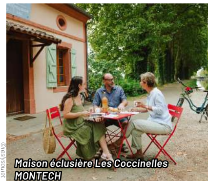
Maison éclusière Les Coccinelles MONTECH