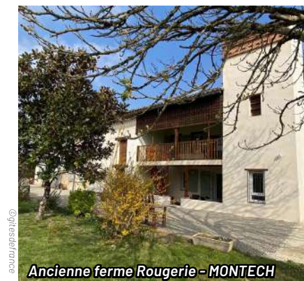
Ancienne ferme Rougerie - MONTECH