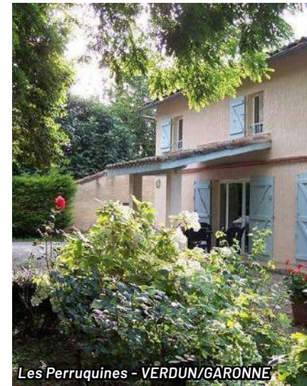
Les Perruquines - VERDUN / GARONNE