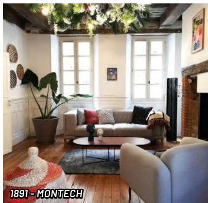
1891 - MONTECH