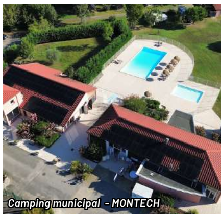
Camping municipal - MONTECH