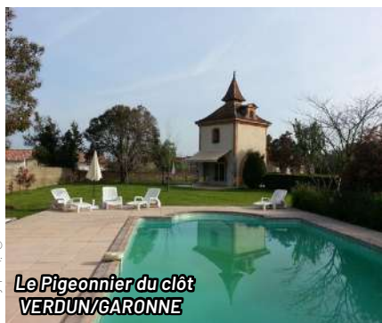
Le Pigeonnier du clôt VERDUN/GARONNE

À partir de 150€ la nuit / 2 nuits minimum