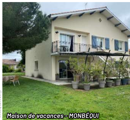
Maison de vacances - MONBÉQUI