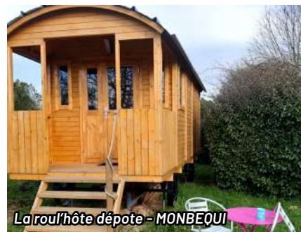
La roull'hôte dépote - MONBEQUI

À partir de 100€/nuit. Petit-déjeuner inclus