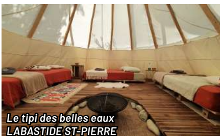
Le tipi des belles eaux LABASTIDE ST-PIERRE