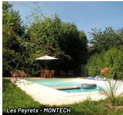
Les Peyrets - MONTECH