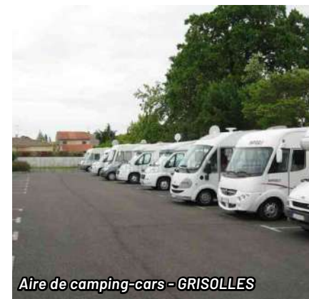
Aire de camping-cars - GRISOLLES