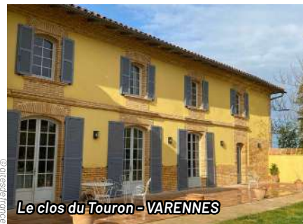
Le clos du Touron - VARENNES