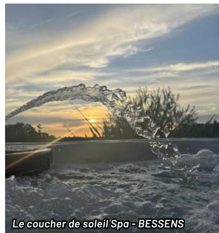
Le coucher de soleil Spa - BESSENS