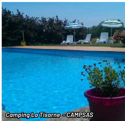
Camping La Tisarne - CAMPSAS