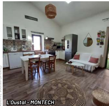
L'Oustal - MONTECH