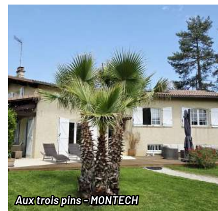
Aux trois pins - MONTECH