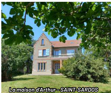
La maison d'Arthur - SAINT-SÂRDOS

À partir de 100€/nuit ( minimum 4 nuits)