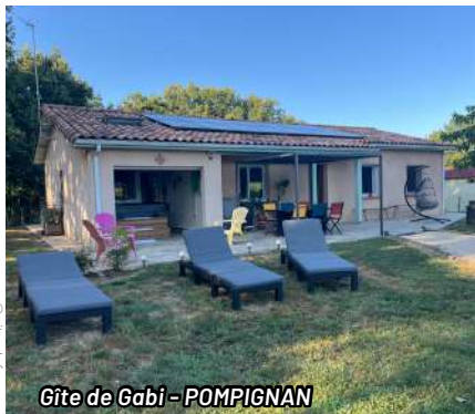
Gîte de Gabi - POMPIGNAN