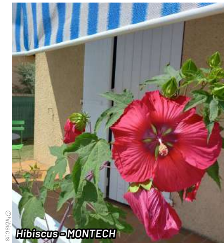
Hibiscus - MONTECH