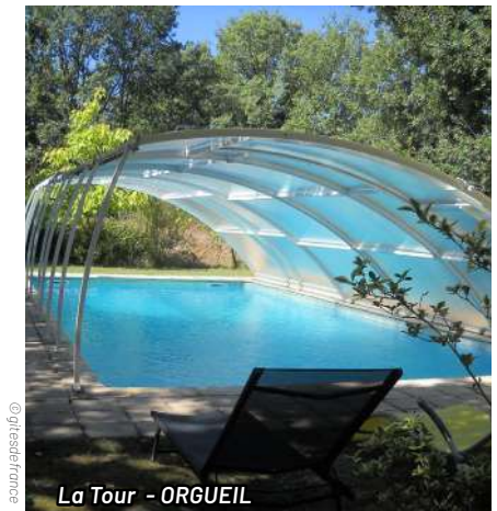
La Tour - ORGUEIL